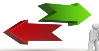
Схема построения профессионального образа будущего

Важно позаботиться о том, чтобы приобретаемые тобой сведения о той или иной профессии не оказались искаженными, неполными.